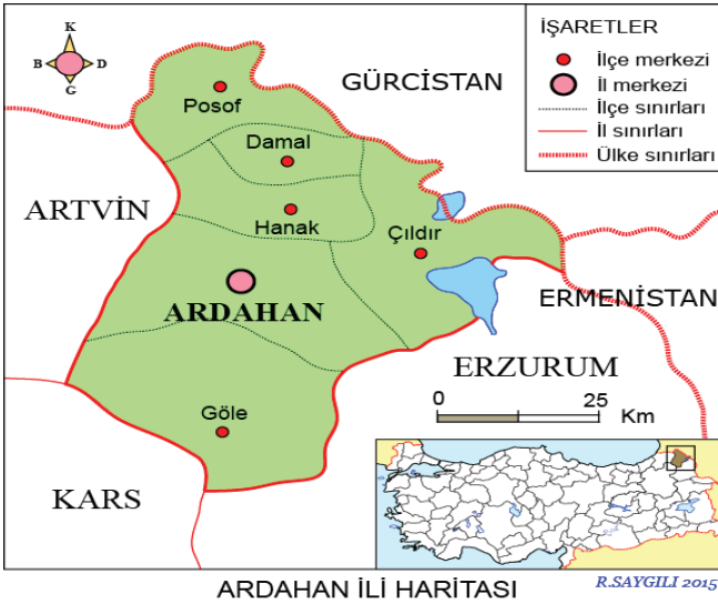
Harita: Ardahan İlinin Konumu

Ardahan ili 1992 yılında Bakanlar Kurulu kararı ile Kars'ın bir ilçesi iken il olmuştur. Coğrafi konum olarak Türkiye'nin Artvin'le beraber kuzeydoğu sınırında yer almaktadır. İlin yüz ölçümü beş bin km 2 dir. Ardahan ilinin ilçeleri, Göle, Hanak, Çıldır, Damal ve Posof'tur. Posof ilçesinin rakımı 1500 m olup diğer tüm ilçe ve il merkezi 1850-1950 m yüksekliğinde rakıma bağlı olarak Posof ilçesinin iklimi diğer ilçelerden farklıdır. Posof ilçesi, mikro klima özelliği göstermektedir (Ardahan İl Çevre Durum Raporu, 2009).